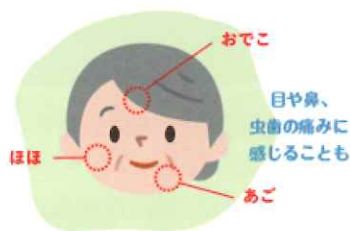
ほほ、あご、おでこなどさまざまな部分(片側)に