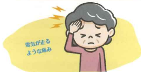
わずか数秒の刺すような痛み

特発性三叉神経痛の原因は、頭の中で、脳から出たばかりの三叉神経（最初は1本で始まり、3本に分かれます）が、ちょうど近くにある脳血管で圧迫されることで、神経が興奮してしまって激痛の感覚をつくってしまうことにあります。治療法は①薬物治療②手術③ガンマナイフ治療④神経ブロックが主にあります。まず、①で治療開始されることが多いですが、もっとも効果的な治療となるのが②となります。頭の中で神経を圧迫している血管の位置をずらす治療で微小血管減圧術、微小血管移動術などと呼ばれます。9割の方に効果が期待できます。治療がうまくいけば、その直後から完全に痛みから開放され、非常に満足度の高い治療です。当院脳神経外科では、ここ10年ほどこの治療を積極的に行っており、多くの方に満足いただいています。