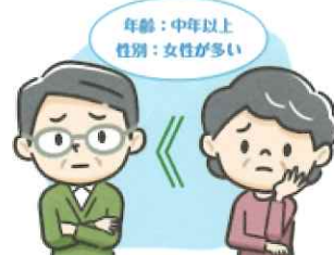
40歳以上が多く男性より女性が多い